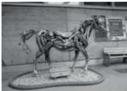
FIGURA 2-ESCULTURA DE UM CAVALO FEITA EM MADEIRA DE HEATHER JANSCH

4 –Muitos artistas buscam na natureza materiais para compor suas obras. Esse é o caso de Heather Jansch que produz esculturas ressignificando materiais como essa escultura de madeira de um cavalo produzida por ele.