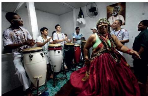
Dança e música em terreiro de Candomblé

Disponível em: https://pixabay.com/pt/photos/garota-filho-crian%C3%A7a-rezar-1894125/ . Acesso em: 23 ago. 2021.