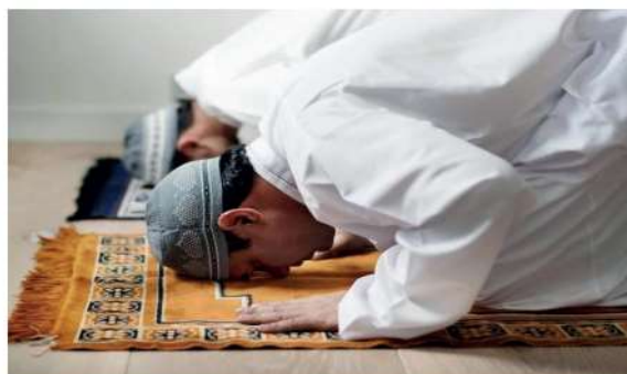
Muçulmanos realizam o Salat.

Os muçulmanos fazem oração cinco vezes por dia, prostrando-se em direção a Meca. Esse ritual é chamado Salat .