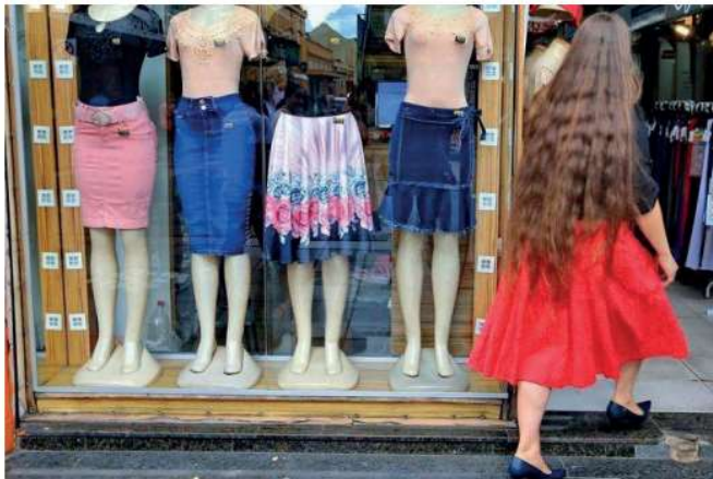
Fachada de loja de roupas voltada para o público evangélico