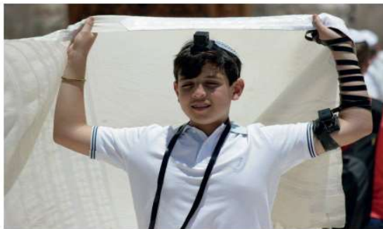
Menino judeu usando um talit.