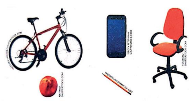
Imagens disponíveis em: Livro "A conquista da matemática", 3º ano – página 65, 2018.