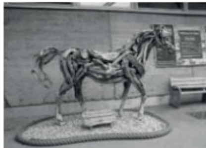
FIGURA 2-ESCULTURA DE UM CAVALO FEITA EM MADEIRA DE HEATHER JANSCH

4 – Muitos artistas buscam na natureza materiais para compor suas obras. Esse é o caso de Heather Jansch que produz esculturas ressignificando materiais como essa escultura de madeira de um cavalo produzida por ele.