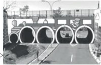
Figura 2 – Fonte: https://www.imparcial.com.br/noticias/intervencao-artistica-chega-a-viaduto-de-prudente,26798

IMAGEM B, DEPOIS COM INTERVENÇÃO ARTÍSTICA DE RICHARD DE ALMEIDA →