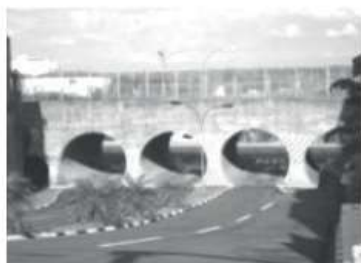
Figura 1 – Fonte: https://mapio.net/s/29422591/

1 – Observe as imagens abaixo da área que liga a avenida Manoel Goulart à rua Mendes de Moraes na cidade de Presidente Prudente no estado de São Paulo.