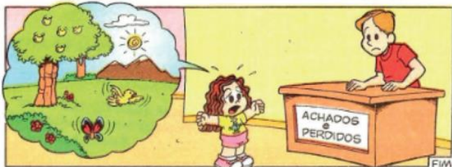
MÔNICA. Rio de Janeiro: Editora Globo, n. 209, nov. 2003. p. 28-29.

C) COMO VOCÊ SE SENTE QUANDO VÊ A DESTRUIÇÃO DA NATUREZA?