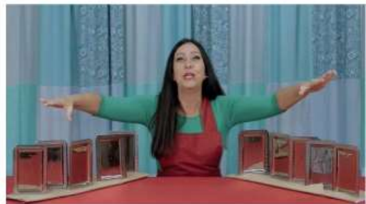
Imagem do vídeo, disponível em: https://www.youtube.com/watch?v=-MZ1AkoXtY . Acesso em: 07 jul. 2021.