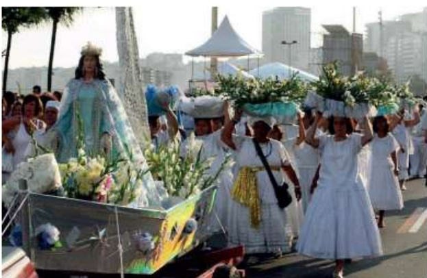
Festa de Iemanjá em Salvador, BA.

exemplo, a Lagoa da Pampulha, em Belo Horizonte. Nessa ocasião, há muito canto, dança e oferendas à orixá, principalmente de rosas brancas, perfumes, espelhos, bijuterias, velas e alguns tipos de alimentos.