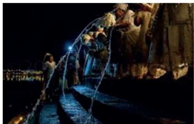
Festa de Iemanjá na Lagoa da Pampulha.

Disponível em: https://uniaonoticias.com/festa-de-ianjanja-02-de-fevereiro/ . Acesso em: 26 ago. 2021.