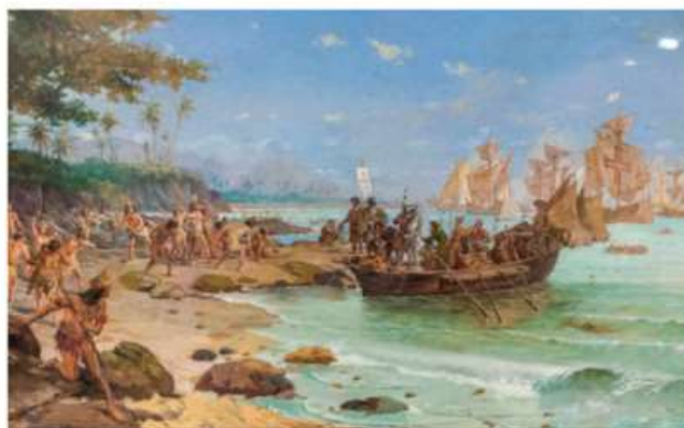
Imagem da Desembarque de Pedro Álvares Cabral em Porto Seguro

Em 1500, quando os portugueses chegaram ao território que hoje forma o Brasil, encontraram diversos povos indígenas. Esses povos viviam em nações organizadas, cada uma com seus hábitos e sua língua. Historiadores afirmam que entre 3 milhões e 5 milhões de indígenas viviam aqui na época da chegada dos portugueses. Hoje, de acordo com o Censo demográfico de 2010, há pouco mais de 896 mil indígenas no país. [...]