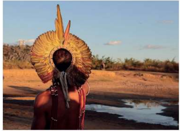
Figura 3: Disponível em: < https://commons.wikimedia.org/wiki/File:%C3%8Dndio_patax%C3%B3_em_Bom_Jesus_da_Lapa.jpg >. Acesso em: 06 ago. 2021.

Milhares de indígenas adoeceram e morreram ao entrar em contato com doenças dos colonizadores europeus. Muitos grupos foram mortos pelos colonizadores em combates, massacres e trabalhos forçados. Outra mudança causada pela presença dos portugueses foi o deslocamento de populações indígenas do litoral para o interior. Em nossos dias, os povos indígenas que restaram estão espalhados pelo Brasil. Esses grupos, porém, não moram apenas no interior e em Terras Indígenas demarcadas: de acordo com o Censo demográfico de 2010, dos pouco mais de 896 mil indígenas do Brasil, cerca de 324 mil vivem em áreas urbanas.