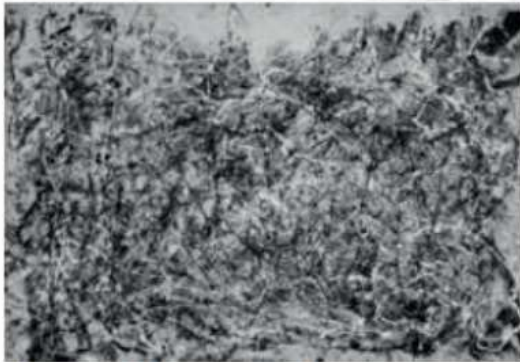
FIGURA 2-NÚMERO 1A, 1948 – JACKSON POLLOCK

2 –O desenho acima é de Albrecht Dürer , “Homem tocando alaúde”, vamos colorir com muito capricho.