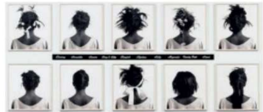
Figura 2 -Stereo Styles, de Lorna Simpson

Veja essa obra (à direita) da artista norte-americana Lorna Simpson. Os aspectos da identidade observados nela são os penteados afro-americanos. Por meio da produção artística podemos