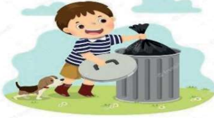
Imagem disponível em: https://image.freepik.com/vetores-gratis/desenho-de-um-menino-levando-o-lixo-para-fora-criancas-fazendo-tarefas-domesticas-em-casa-conceito_283146-381.jpg . Acesso em: 17 jul. 2021.

Disponível em: https://memoria.ebc.com.br/infantil/voce-sabia/2015/08/ajudar-em-casa-e-trabalho-infantil .