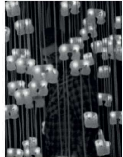
Figura 1- Bion, de Adam Brown e Andrew H. Fagg. Alto falantes, luzes de LED e múltiplos sensores.

A máquina fotográfica, o vídeo, o computador, o celular e a internet são exemplos de tecnologias que deram asas à criação dos artistas. Os recursos tecnológicos permitem que muitas obras promovam a interação com o público. Observe a imagem ao lado, essa é uma instalação dos artistas Adam Brown e Andrew H. Fagg. A obra é composta por objetos que lembram pequenas criaturas azuis feitas com luzes de LED, que se comunicam entre si ao terem contato com os visitantes. Essas criaturas são chamadas de Bions. Essa vivência somente foi possível com o uso de alto-falantes. É a tecnologia a serviço da arte