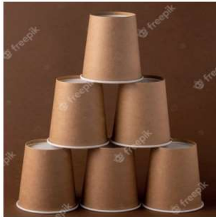
Imagem disponível: < https://image.freepik.com/fotos-gratis/piramide-de-copos-de-papel-em-um-fundo-marrom_245188-3.jpg >. Acesso em: 06 ago. 2021.

FAÇA UMA TORRE COM OS 6 COPOS COMO NO DESENHO ABAIXO: