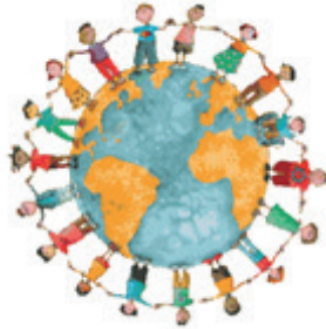
Imagem disponível em: < https://souleitoreconhecedorodomundo.files.wordpress.com/2013/07/eaffa-roda_grande.png?w=584 >. Acesso em: 30 de maio de 2021.