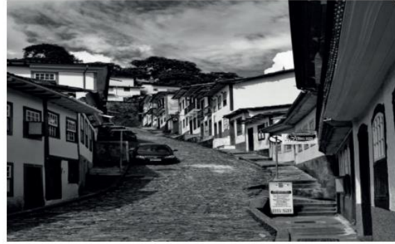
Figura 12 Rua do Pilar, 2019.