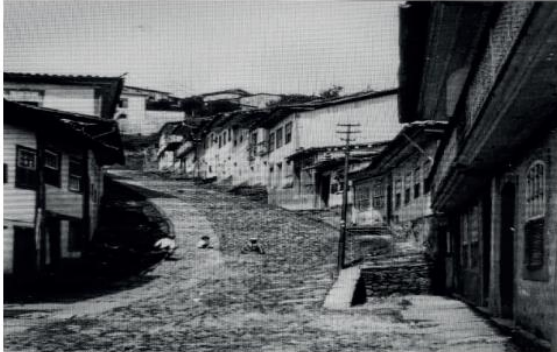
Figura 11 Rua dos Vigários e dos Caldeireiros, 1940 (atual Rua do Pilar)