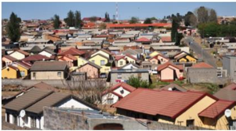
( C )