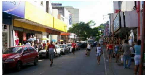
( A )