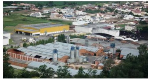
( B )

Disponível em: < http://s2.glbimg.com/NulqC1Se57lHF5JFdQR6dFFS6Mk=/290x217/s2.glbimg.com/pgVW28w895smxw9ehnrtoWU3Bhk=/s.glbimg.com/jo/g1/f/original/2014/12/02/bairros_munhoz.jpg >. Acesso em: 22 de abr. de 2021.