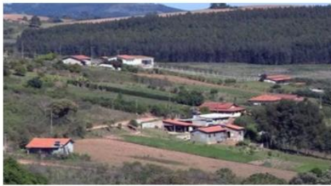
( D )