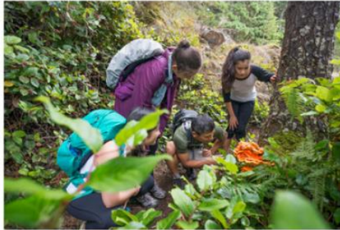
ALUNOS DE UMA ESCOLA MUNICIPAL DO RIO DE JANEIRO ESTUDAM CIÊNCIAS NA FLORESTA DA TIJUCA.