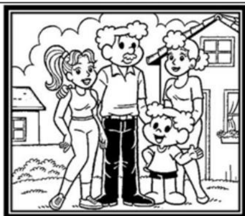
FAMÍLIA DO XAVECO