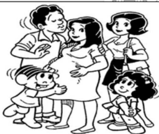
FAMÍLIA DA MÔNICA

Disponível em: < https://www.tudodesenhos.com/d/familia-do-chico-bento >. Acesso em: 11 de maio de 2021.