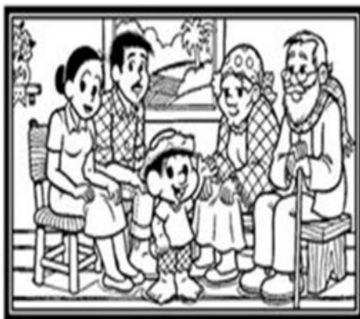
FAMÍLIA DO CHICO BENTO

3 - OBSERVE AS DIFERENTES FAMÍLIAS DA TURMA DA MÔNICA.