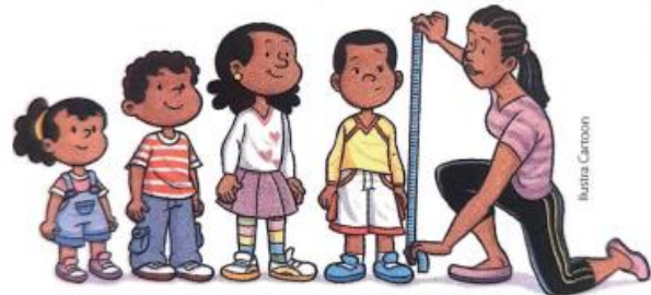
Imagem extraída do livro Novo bem-me-quer matemática, 2º ano. Ed. do Brasil 2017.

Fonte: Dados elaborados para esta atividade.