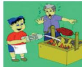
Garrafa de álcool