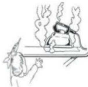
Ferro de passar roupa