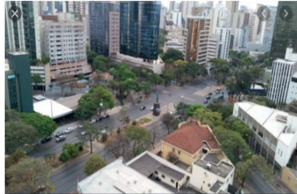
AVENIDA AFONSO PENA – BH 2021