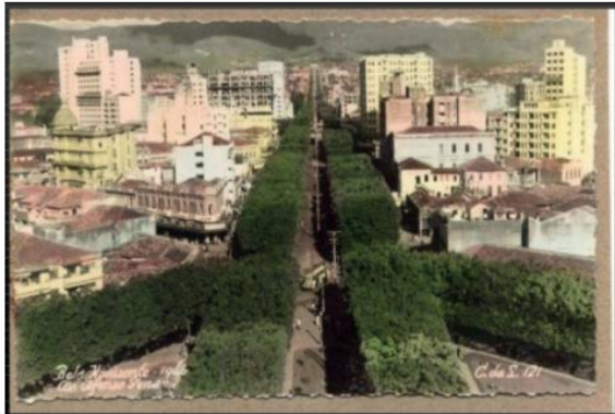
AVENIDA AFONSO PENA – BH 1946