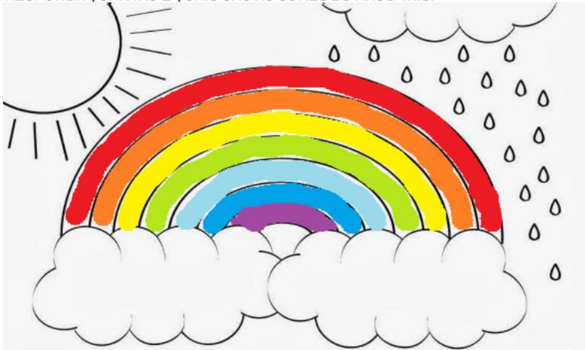
Imagem disponível em: < https://raskrasil.com/pt/desenho-de-arco-iris-para-colorir-imprimir-gratuitamente-no-site/ >. Acesso em: 19 set. 2020.

1 – PESQUISE QUAIS SÃO AS CORES DO ARCO-ÍRIS E PINTE O DESENHO ABAIXO. DEPOIS RESPONDA QUANTAS E QUAIS SÃO AS CORES DO ARCO-ÍRIS.