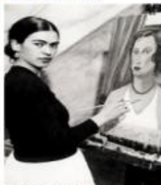
Frida Khalo, 1931