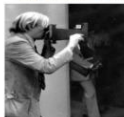
Andy Warhol e Pelé, 1978