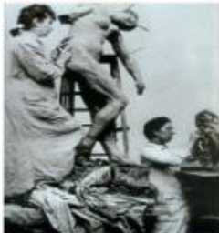
Camille Claudel, 1887