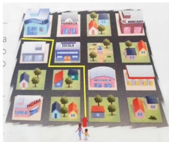
Imagem extraída do livro – 3º Ano Integrado – Ensino Fundamental – Matemática página- p. 44 – 2018.