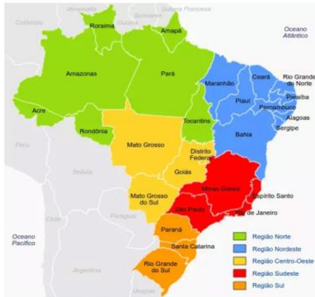
Imagem disponível em: < https://www.monolitonimbus.com.br/divisao-territorial-brasileira/ >. Acesso em: 08 de abril de 2021.

1- Observe a imagem do mapa do Brasil e responda: