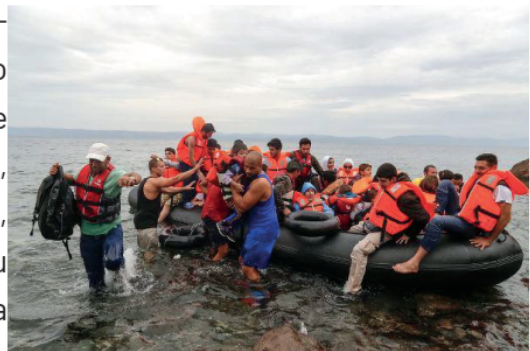
Milhares de migrantes, muitos da Síria, Iraque e Afeganistão, realizam a travessia do mar Egeu, da Turquia, para chegar às ilhas gregas – porta de entrada da Europa *

(...) De acordo com um relatório da ONU, nos primeiros 15 anos do século XXI houve um aumento de 41% no número de migrantes no mundo, que chegou a aproximadamente 244 milhões, desses, cerca de um terço (76 milhões) vivem na Europa, 75 milhões na Ásia, continente que mais recebeu migrantes nesses últimos 15 anos, e 54 milhões na América do Norte. Considerando apenas o país com maior número de migrantes, os Estados Unidos lideram com 47 milhões de migrantes, seguido por Alemanha e Rússia, que possuem 12 milhões cada; Arábia Saudita com 10 milhões; Reino Unido com quase 9 milhões e Emirados Árabes Unidos com 8 milhões. Demonstrando, assim, que pelo menos nessas primeiras décadas do século XXI os fluxos migratórios para os países desenvolvidos ou países subdesenvolvidos com economias mais dinâmicas se manteve.